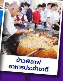
ข้าวพิลอฟ อาหารประจำชาติ