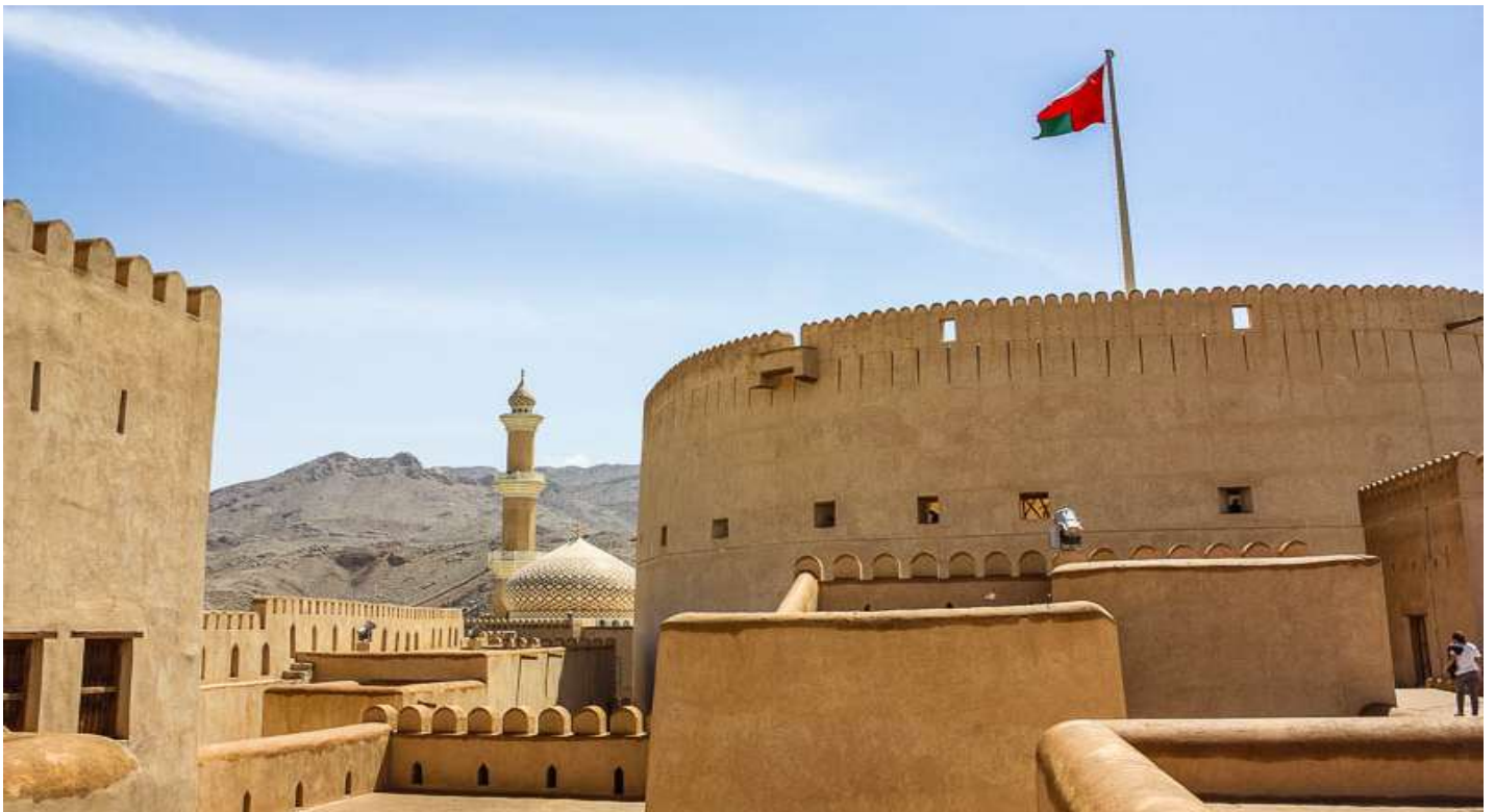
นำท่านเดินชมตลาดพื้นเมืองนิซวา ( Nizwa Souq ) ที่ท่านสามารถเลือกซื้อของฝาก ของที่ระลึก สินค้าพื้นเมือง เป็นตลาดที่มีชีวิตชีวาตามแบบชาวโอมาน สินค้าที่มีขายมีทั้งเครื่องประดับทำมือ เครื่องเงิน เครื่องหนัง กาแฟ และของประดับตกแต่งบ้านสไตล์โอมาน