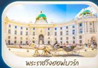
พระราชวังฮอฟบวร์ก

12-18 มี.ค.68 / 19-25 มี.ค.68 28 เม.ย. - 4 พ.ค.68 7-13 พ.ค.68