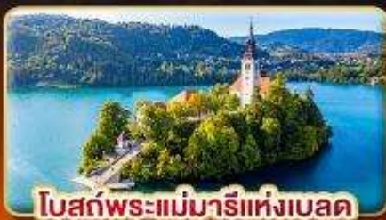
โบสถ์พระแม่มาเรียแห่งเบลด