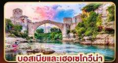
บอสเนียและเฮอร์เซโกวีนา