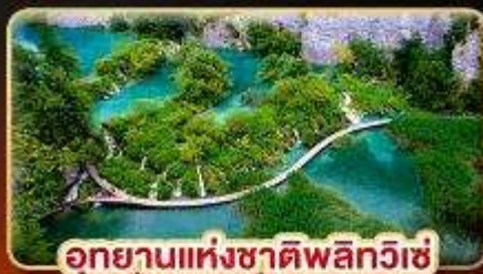
อุทยานแห่งชาติพลิกวิเช