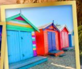
โบสถ์ต้น บาร์ตัง บ็อกซ์