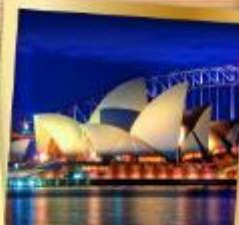
ซิดนีย์ไอเปอร์่า