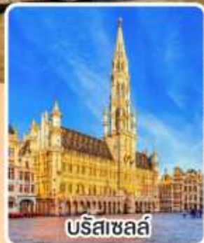
บรีสาเซลล์

พิเศษ!! เมนู หอยแอสคาโต้, จากหมู่บ้านเยอรมัน หอยแมลงภู่อบไวน์ขาว