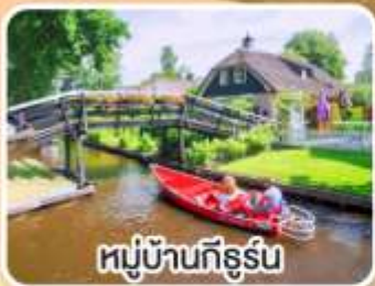
หมู่บ้านทึร์น