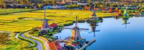
เข้าชมหมู่บ้านชานนิสคันส์