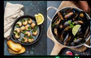
เมนูอาหารสุดพิเศษ !! หอยแมลงภู่อบไวน์ขาว และหอยแอสคาโต้