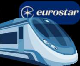
รถไฟความเร็วสูง จาก เบลเยียม สู่ ฝรั่งเศส