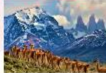
อุทยานแห่งชาติตอร์เรส เดล เพน