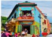
เมืองบัวโนสไอเรส

xx.xx น. ออกเดินทางสู่กรุงบัวโนสไอเรส เพื่อการบิน... xx.xx น. เดินทางถึงสนามบินบัวโนสไอเรส ประเทศอาร์เจนตินา