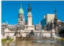
ชมเมืองบัวโนสไอเรส

23.55 น. ออกเดินทางสู่สนามบินอีสตันบูล เพื่อการบิน TK16