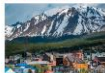
เมืองเอลคาลาฟาเต

** พักที่ Xelena Hotel 4* หรือเทียบเท่า **