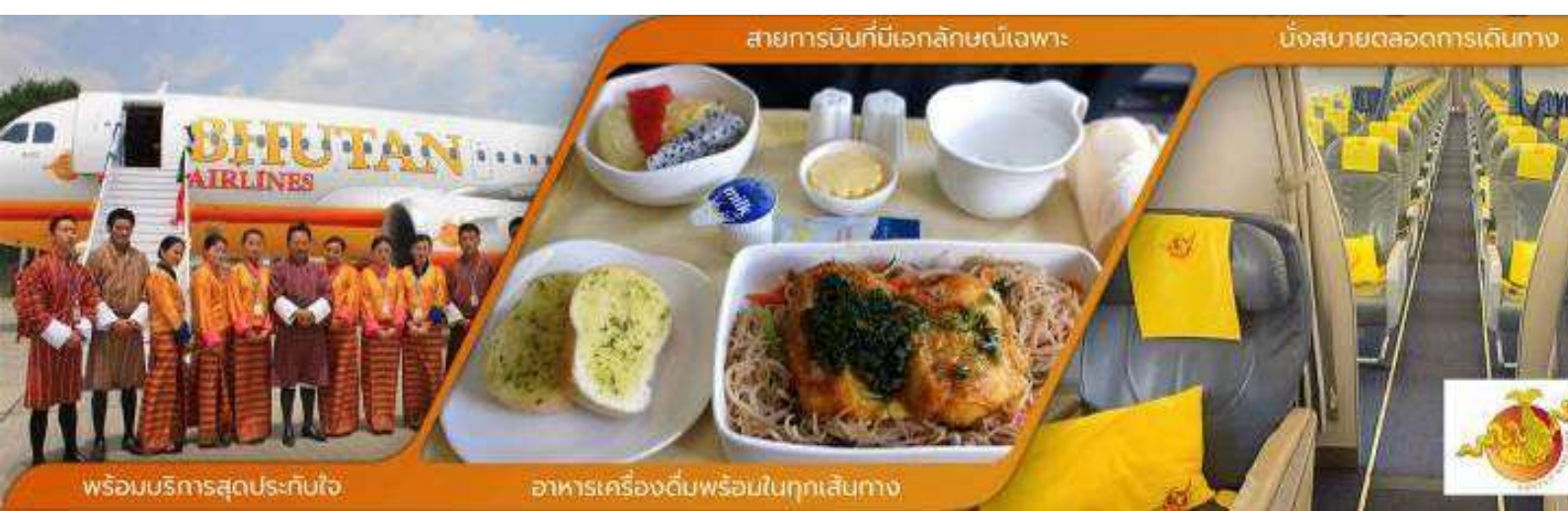
พร้อมบริการสุดประทับใจ อาหารเครื่องดื่มพร้อมในทุกเส้นทาง เครื่อง***)

09.55 น. เดินทางถึง สนามบินพาร์ ประเทศภูฏาน นำท่านผ่านพิธีการตรวจคนเข้าเมือง จากนั้นแต่ละท่านรับกระเป๋าสัมภาระที่โหลดตรวจเช็คให้เรียบร้อยและออกเดินทางเข้าสู่ตัว เมืองพาร์ ประเทศภูฏาน เป็นประเทศเล็กๆ ที่เป็นดินแดนรวมแหล่งอารยธรรมต่างๆ ในอ้อมกอดแห่งขุนเขาหิมาลัย เป็นประเทศที่พุทธศาสนาแบ่งบานอยู่ท่ามกลางเทือกเขาหิมาลัย ประชาชนชาวภูฏานมีธรรมะเป็นสิ่งยึดเหนี่ยวทางจิตใจ ประชาชนดำรงชีวิตกันอย่างเรียบง่ายไม่วุ่นวาย และความสุขของคนภูฏานวัดกันได้ที่ใจ.. ความสุขอยู่ที่จิตใจที่มีแต่รอยยิ้ม..และความเป็นมิตรแก่ผู้คนทั้งโลก ทุกท่านจะได้สัมผัสบ้านเมืองที่ เมืองพาร์ซึ่งเป็นเมืองที่ถูกโอบอยู่ในวงล้อมของขุนเขา บนระดับความสูง 2,280 เมตร มีแม่น้ำปาซูลไหลผ่านอาคารบ้านเรือนจะเป็นสไตล์ภูฏานแท้ กรอบหน้าต่างไม้ลวดลายสีสนิมสดใส นำท่านเดินทางไม่ไกล ชม พิพิธภัณฑ์สถานแห่งชาติ (NATIONAL MUSEUM) พิพิธภัณฑ์แห่งนี้เป็นที่เก็บรวบรวมหน้ากากศิลปะแบบพุทธมหายาน นิเกยตันตระ ภาพพระบฏ อวูธ เหริยญาปณ์ เครื่องมือเครื่องใช้ไม้สอยต่างๆ รวมถึงจัดแสดงความหลากหลายทางธรรมชาติอันสมบูรณ์ของประเทศ เพื่อให้ทุกท่านได้รู้จักภูฏานมากขึ้น ตรงข้ามกับอาคารพิพิธภัณฑ์ เป็นอาคารทรงกลมสีขาว เรียกว่า ตาซอง (TA DZONG) หรือ หอคอย เดิมใช้เป็นหอสังเกตการณ์ข้าศึกศัตรู เนื่องจากตัว Dzong สร้างอยู่บนเนินสูง สามารถมองวิวตัวเมืองพาร์ได้ครอบคลุม (นำทุกท่านถ่ายรูปด้านนอก เนื่องจากขณะนี้ Ta Dzong กำลังปิดปรับปรุง)