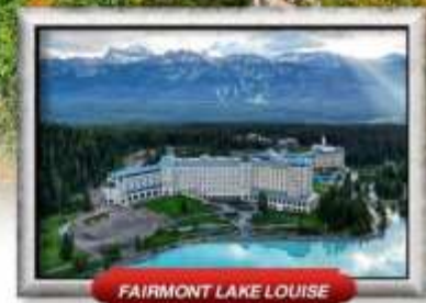
FAIRMONT LAKE LOUISE

บินทรู สายการบิน Full Service | เมนูพิเศษ! แคนาดาเคียนลิออนสแควร์