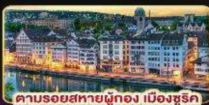
คาบรอยสหายผู้ทอง เมืองซูริค