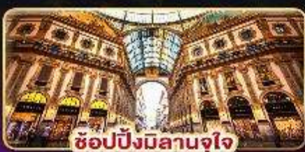
ช้อปปิ้งมิลานจุใจ

เดินทาง : 9-16 ก.พ. / 9-16 มี.ค. / 23-30 มี.ค. 88