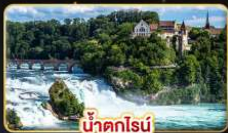
น้ำตกโรน