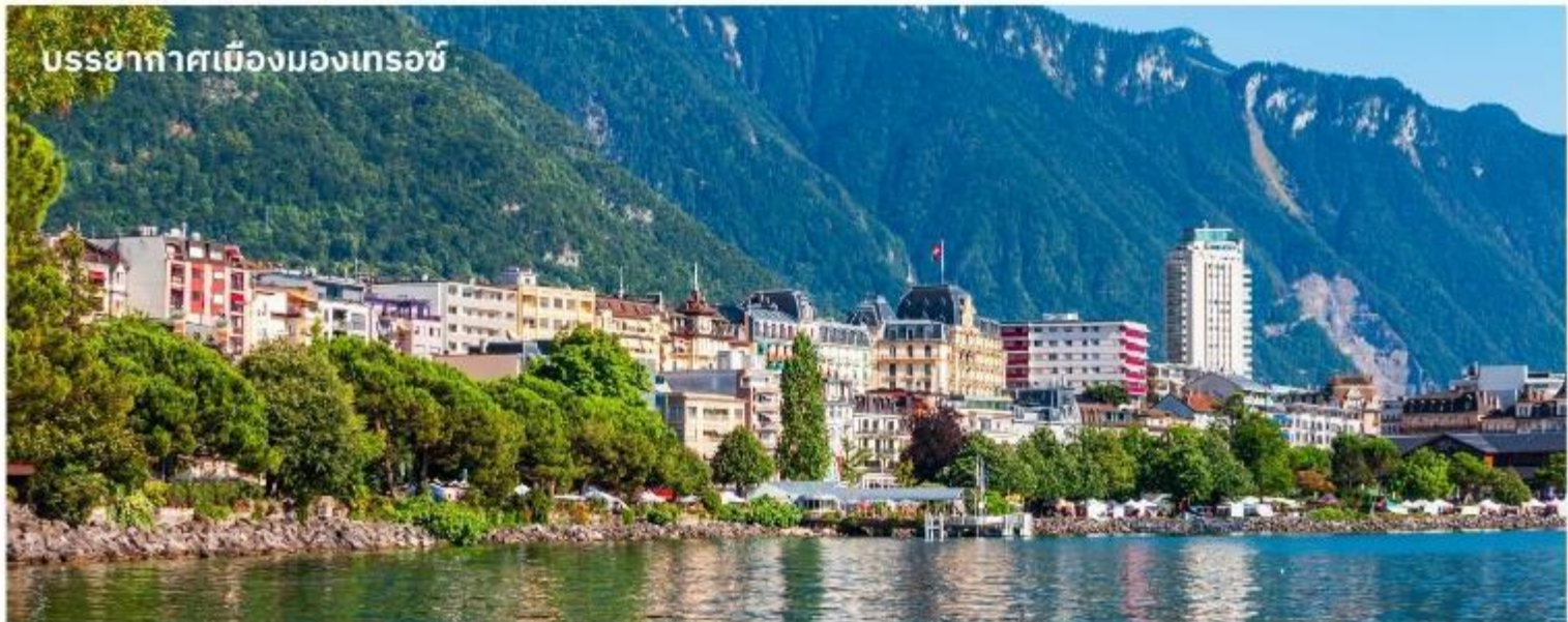
บรรยากาศเมืองมงเทรอซ์

จากนั้นนำท่านเดินทางสู่ เมืองแทสซ์ (Tasch) ด้วยรถไฟ และเดินทางด้วยรถบัสต่อไปยัง เมืองมงเทรอซ์ (Montreux) ใช้เวลาเดินทางประมาณ 2 ชั่วโมง เมืองตากอากาศที่ตั้งอยู่ริมทะเลสาบเจนีวา ได้ชื่อว่าเป็นริเวียร่าของสวิส ชมความสวยงามของทิวทัศน์ บ้านเรือน ริมทะเลสาบ นำท่านถ่ายรูปด้านหน้า ปราสาทซิลยอง (Chillon castle) ปราสาทโบราณอายุกว่า 800 ปี สร้างขึ้นบนเกาะหินริมทะเลสาบเจนีวา ตั้งแต่ยุคโรมันเรื่องอำนาจโดยราชวงศ์ SAVOY โดยมีจุดมุ่งหมายเพื่อควบคุมการเดินทางของนักเดินทางและขบวนสินค้าที่จะสัญจรผ่านไปมาจากเหนือสู่ใต้หรือจากตะวันตกสู่ตะวันออกของสวิตเซอร์แลนด์ เนื่องจากเป็นเส้นทางเดียวที่ไม่ต้องเดินทางข้ามเทือกเขาสูงชัน ปราสาทแห่งนี้จึงเปรียบเสมือนด่านเก็บภาษีซึ่งเอาเปรียบชาวสวิสมานานนับร้อยปี