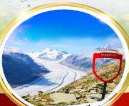
อาเล็กซารีนา