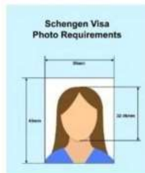
ตัวอย่างรูปถ่าย