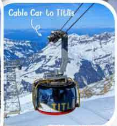
Cable Car Lo Tittel