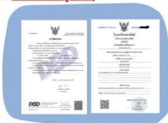
ตัวอย่างหนังสือจดทะเบียนบริษัท และ ใบทะเบียนพาณิชย์