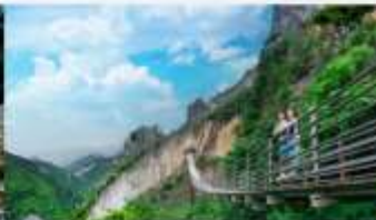
หุบเขารอยแยกอุ๋หลิงซาน