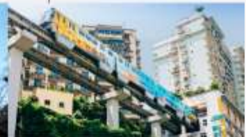
รถไฟฟ้าทะเลตึก

*ทางบริษัทฯ ขอสงวนสิทธิ์ในการสลับโปรแกรมทัวร์ตามความเหมาะสมขึ้นอยู่กับสถานการณ์ปัจจุบัน โดยคำนึงถึงผลประโยชน์ของลูกค้าเป็นหลัก