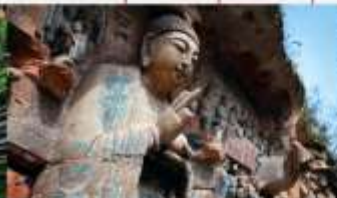
พาคินแกะสลักต้าจู้ เขาเป่าตึงซาน