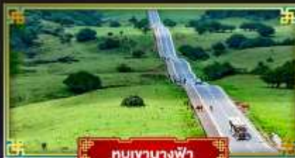
หุบเขานางฟ้า