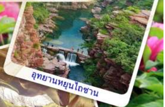
อุทยานหยุนโถซาน