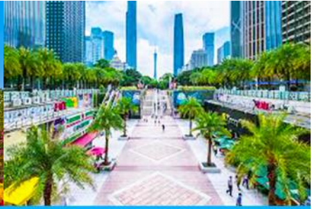
จัตุรัสฮัวเจิง

วันที่สี่ นครกวางเจา - วัดลิวหรงชื่อ - หอที่ระลึกซุนยัตเซน - จตุรัสฮัวเจิง - เกาะไห่ซินซา - กวางเจาทาวเวอร์ - ถนนคนเดินเป่ย์จิงถู่ - เดินทางกลับกรุงเทพฯ