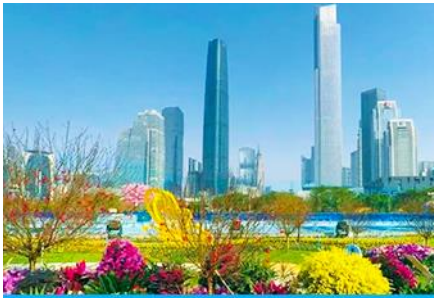
ไห่ซินซา