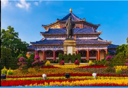
หอที่ระลึกซุนยัตเซน