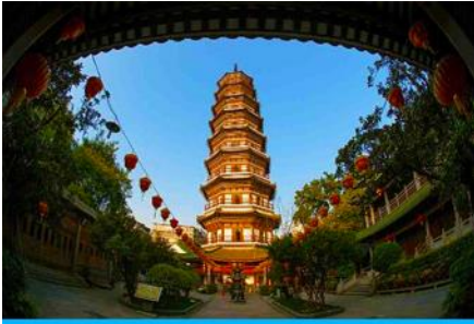
วัดลิวหรงชื่อ