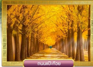
ถนนแปะก๊วย