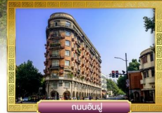
ถนนอันฟู่