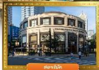
เดอะบับเบิล

☑️ ซื้อบิง POP MART ถ่ายรูปคู่กันคิมอิกซ์