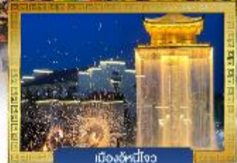
เมืองอู่หนี่โจว