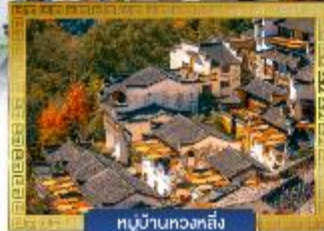
หมู่บ้านทวดลิ่ง