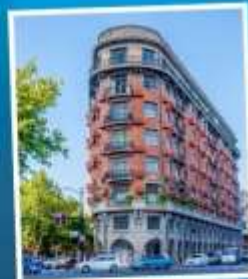
ถนนอู่คัง