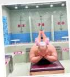
คาเฟ่ผ่อนคลายเหอผิง