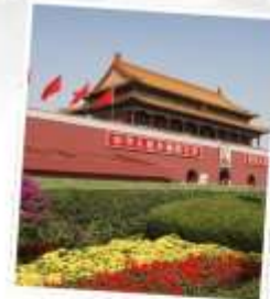
จัตุรัสเทียนอันเหมิน