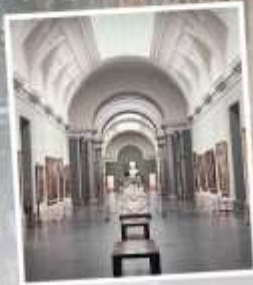
PUDONG ART MUSEUM