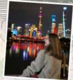
เซี่ยงไฮ้ คลาสสิก ไนท์