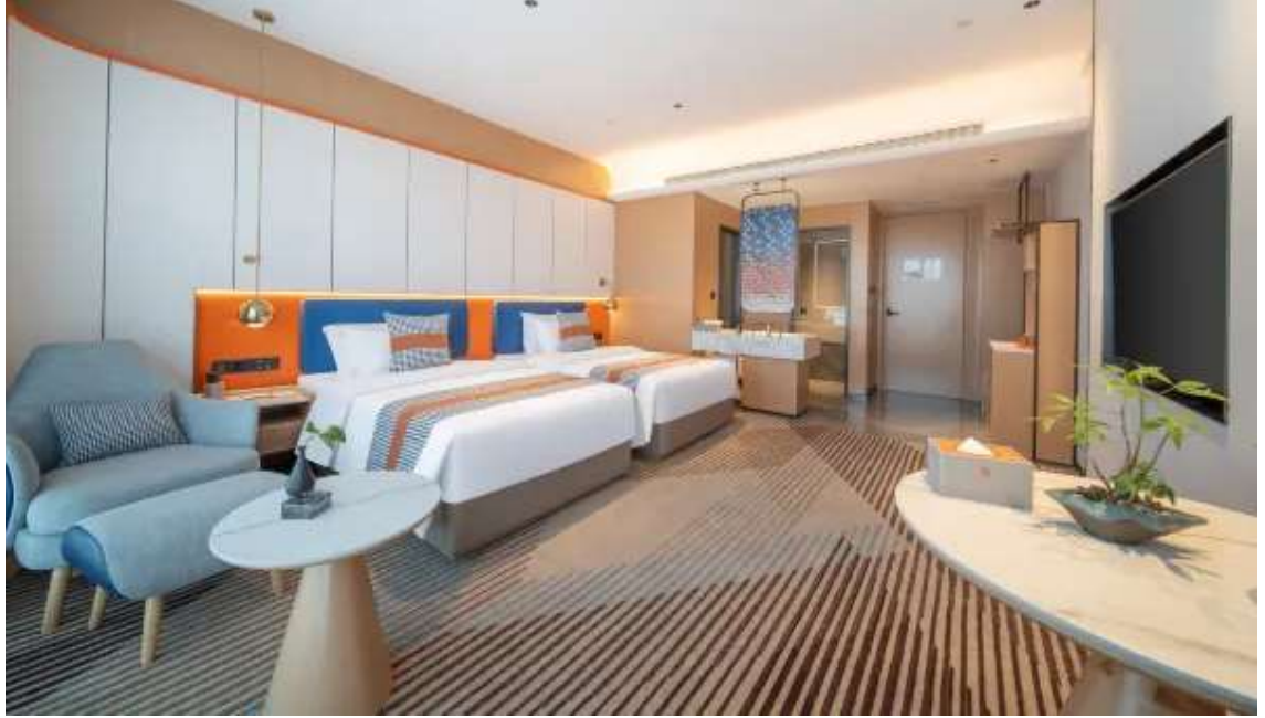
Aksu: HUATUI HOTEL 阿克苏华瑞大酒店 +86-997-2719999 阿克苏市南城街道上海路 60 号 开业: เปิดบริการปี 2023