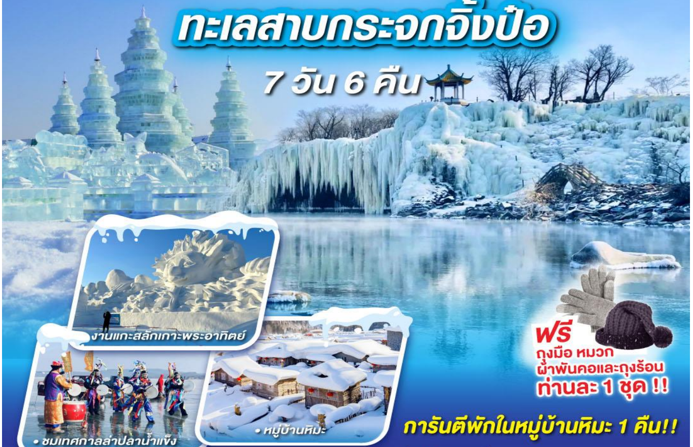
งานแกะสลักเกาะพระอาทิตย์