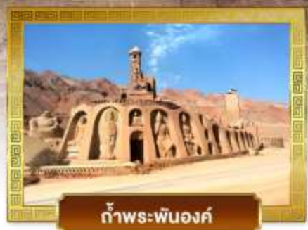
ก้ำพระปันองค์