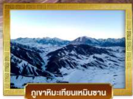
ภูเขาหิมะเทียนเหินซาน