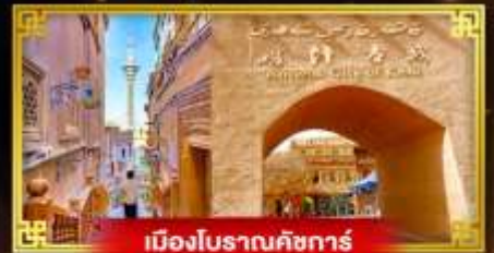
เมืองโบราณคัชการ