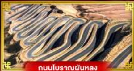
ถนนโบราณผืนหลง

“คัชการ” เที่ยวสุดขอบตะวันตกประเทศจีน เมืองเก่าแห่งยุคเส้นทางสายไหมโบราณ