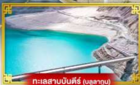
ทะเลสาบบินคีร์ (บุลาคากูบ)