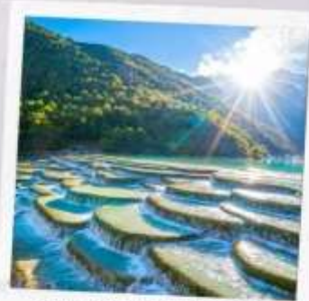
หุบเขาพระจันทร์ สีน้ำเงิน