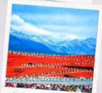
โชว์ จางอีโหมว