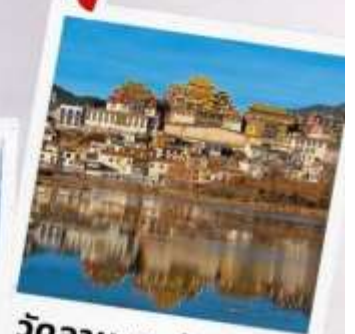
วัดลามะชงจ้านหลิง