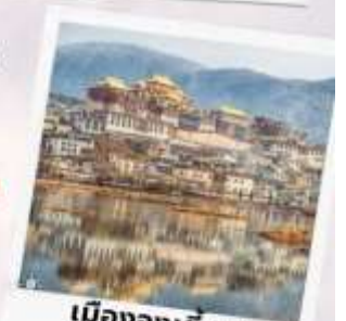
เมืองจงเตียน แซงกรี่ล่า