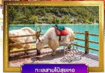
ทะเลสาบไป๋สฺยฺเหอ