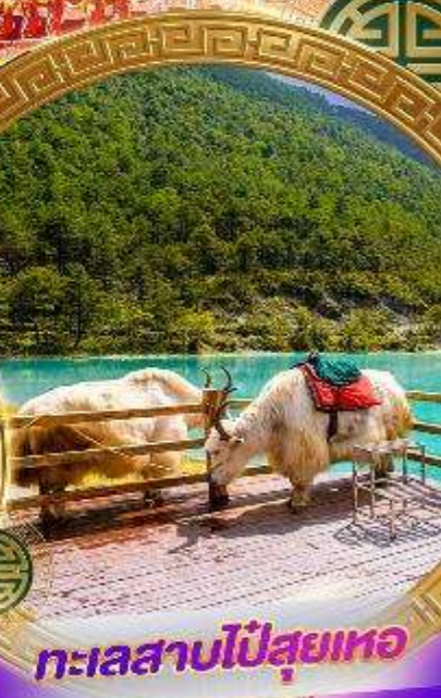
ทะเลสาบไป๋ซุยเทอ