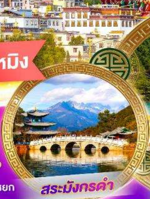
สระมิ่งกรคำ

ท่องเที่ยวชมมิ่งกร ชมความงามภูเขาหิมะมิ่งกรหยก ชมไร่ชาความประทับใจลี้เจียง ชมอุทยานปาลาเก๋อง จุดสูงสุดของแชงกรีล่า นั่งรถไฟความเร็วสูง เมนูสุดพิเศษ!! สุกีปลาเซลมอน, สุกีหัด, อาหารกวางตุ้ง