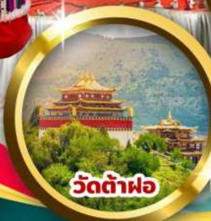
วัดต้าฟอ