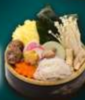
ชาบูเห็ด

★★★★★ พักหรูระดับ 5 ดาว ฟรี!! น้ำหนักกระเป๋า 20 kg.