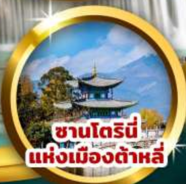
ซานโตรินี แห่งเมืองต้าหลี่