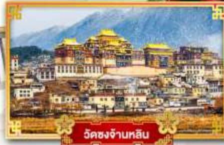
วัดชงจ้านหลิน