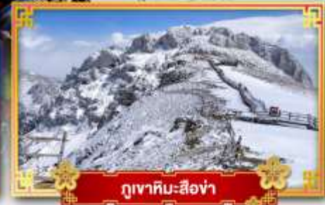
ภูเขาหิมะซือซ่า