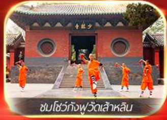
ชมโชว์กังฟูวัดเล้าหลิน