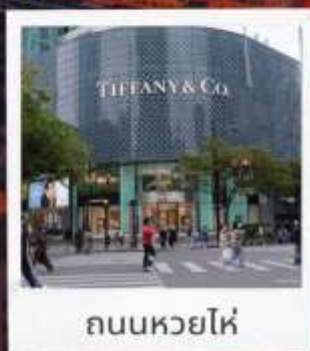
ถนนหวยไห่