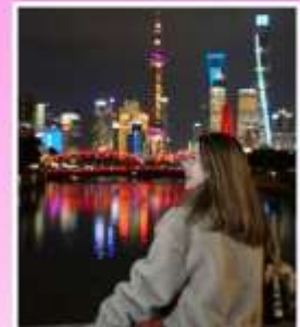
สะพานจ๋าฟู่ชือยอ