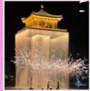
อุ๊นวีโจว