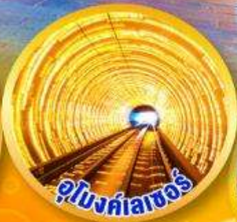
อุโมงค์กาลเซอร์