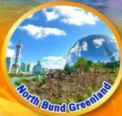
North Bund Greenland