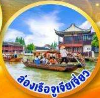
ล่องเรือจูเจียเจียว