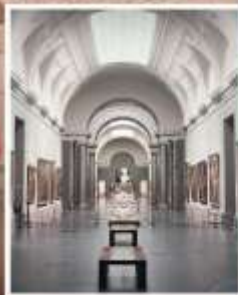
PUDONG ART MUSEUM