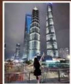
SKYWALK ลู่เจียจู่ย

รับฟรี!! ประกันสุขภาพ และ อุบัติเหตุ 2 ล้านบาท