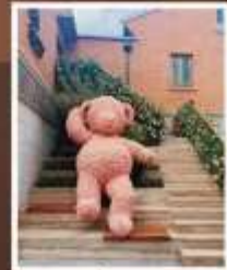
ลัคชีชาร์รี่ แลนด์มาร์ก จางหยวน