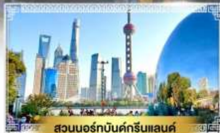
สวนนอร์ทัมดักกรีนแลนด์