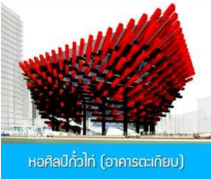
หอศิลป์กั๋วไท่ (อาคารตะเกียบ)