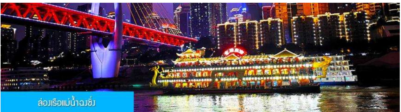
ล่องเรือแม่น้ำจางซี