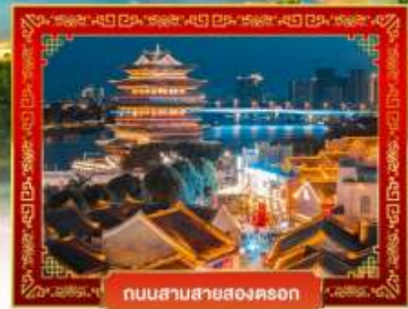
ถนนสามสายสองคอน