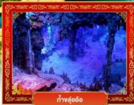
ถ้ำสุ่ยอ้อ