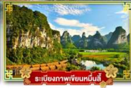
ระเบียงภาพเขียนหมิ่นลี่