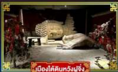
เมืองใต้ดินหวงผู่จิ้ง

“กำแพงหิมะ”...สิ่งมหัศจรรย์ของโลก พระราชวังต้องห้าม อดีตพระราชวังหลวงสุดยิ่งใหญ่