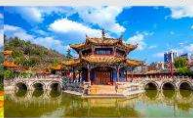
วัดหยวนทง