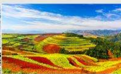
แผ่นดินสีแดง