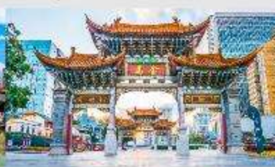
ประตุน้ำทอง ไท่หยก

*ทางบริษัทฯ ขอสงวนสิทธิ์ในการสลับโปรแกรมทัวร์ตามความเหมาะสมขึ้นอยู่กับสถานการณ์หน้างาน โดยคำนึงถึงผลประโยชน์ของลูกค้าเป็นสำคัญ