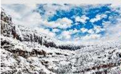
ภูเขาหิมะเจียวจื่อ