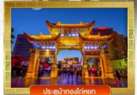
ประตูน้ำทองโก่หยก