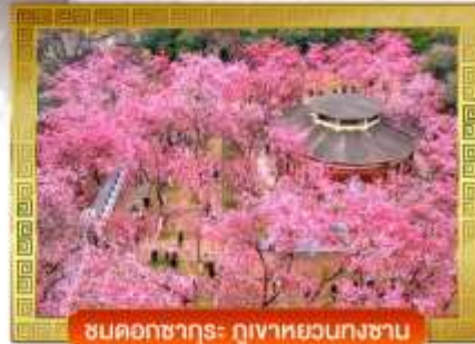
ชมดอกซากุระ ภูเขาหวนกงซาน