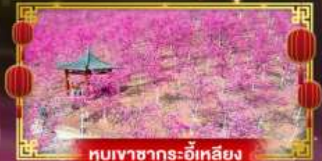
หุบเขาซาถูระอี่หลียง