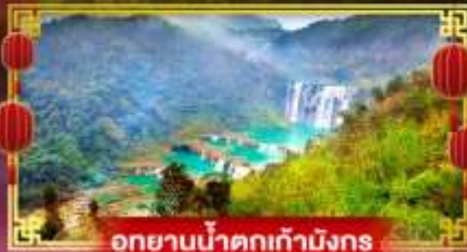
อุทยานน้ำตกเก้ามังกร