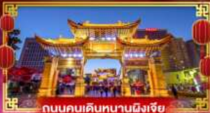
ถนนคนเดินหนานผิงเจีย