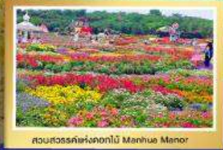
สวนสวรรค์แห่งดอกไม้ Manhuo Manor