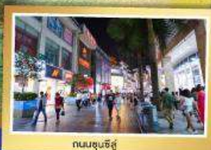
ถนนชุนชี่