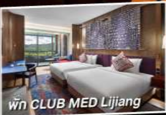
พัก CLUB MED Lijiang