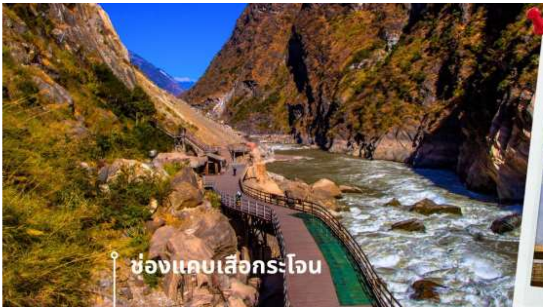
ช่องแคบลือกระโจน

นำท่านแวะชม ช่องแคบลือกระโจน (รวมค่าบริการบันไดเลื่อน ขึ้น-ลง) ซึ่งเป็นช่องแคบช่วงแม่น้ำแยงซีไหลลงมาจากจินซาเจียง(แม่น้ำทรายทอง) เป็นช่องแคบที่มีน้ำไหลเชี่ยวมาก ช่วงที่แคบที่สุดประมาณ 30 เมตร