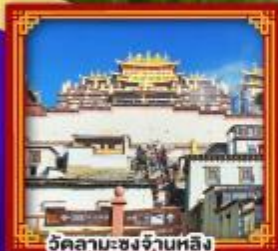
วัดลามะซงจ่าบหลิง