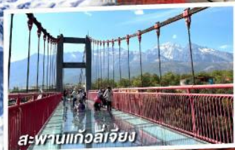
สะพานแก้วลี่เจียง